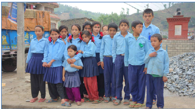
Les 14 enfants de l'internat de Dhading photographiés en mai 2014.

Comme prévu, en avril 2014, 10 nouveaux enfants de Dhading, non encore parrainés, ont été accueillis dans le petit internat, qui a, par ailleurs, transféré 7 enfants vers le Home de Sadobato. SEA a pris en charge les dépenses de santé de certains de ces enfants : au 1 er semestre 2014, deux adlocescentes de l'internat ont été conduites à plusieurs reprises à Katmandou pour y être soignées :