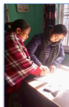
Signature du document par la mère d' Anjali en déc 2017