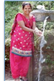
Tara, janvier 2018

En Inde, les sénior sur place sont en charge de s'organiser pour s'autogérer et faire un reporting à Paris de leurs dépenses et comptes bancaires.